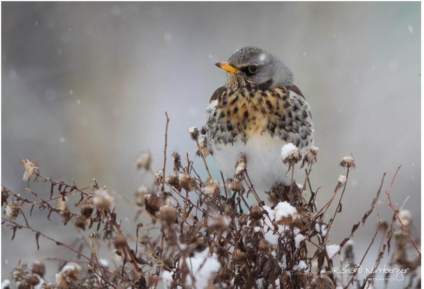
Bericht und Foto Richard Nürnberger – Ortsgruppe Neukirchen

Eine Winterfütterung im Garten ermöglicht die bequeme Beobachtung einer Vielzahl von Vögeln. Die Wacholderdrossel ( Turdus pilaris ) ist dabei eher ein seltener Gast. Als Teilzieher überwintert sie in Süd- und Mitteleuropa; zu uns kommen aber auch Überwinterer aus Nordeuropa. Hauptnahrung im Winter sind Beeren. Durch ihren grauen Kopf, den gelben Schnabel und ihre gelbe Brust sind sie gut von anderen Drosselarten zu unterscheiden. Sie ist nicht gefährdet.