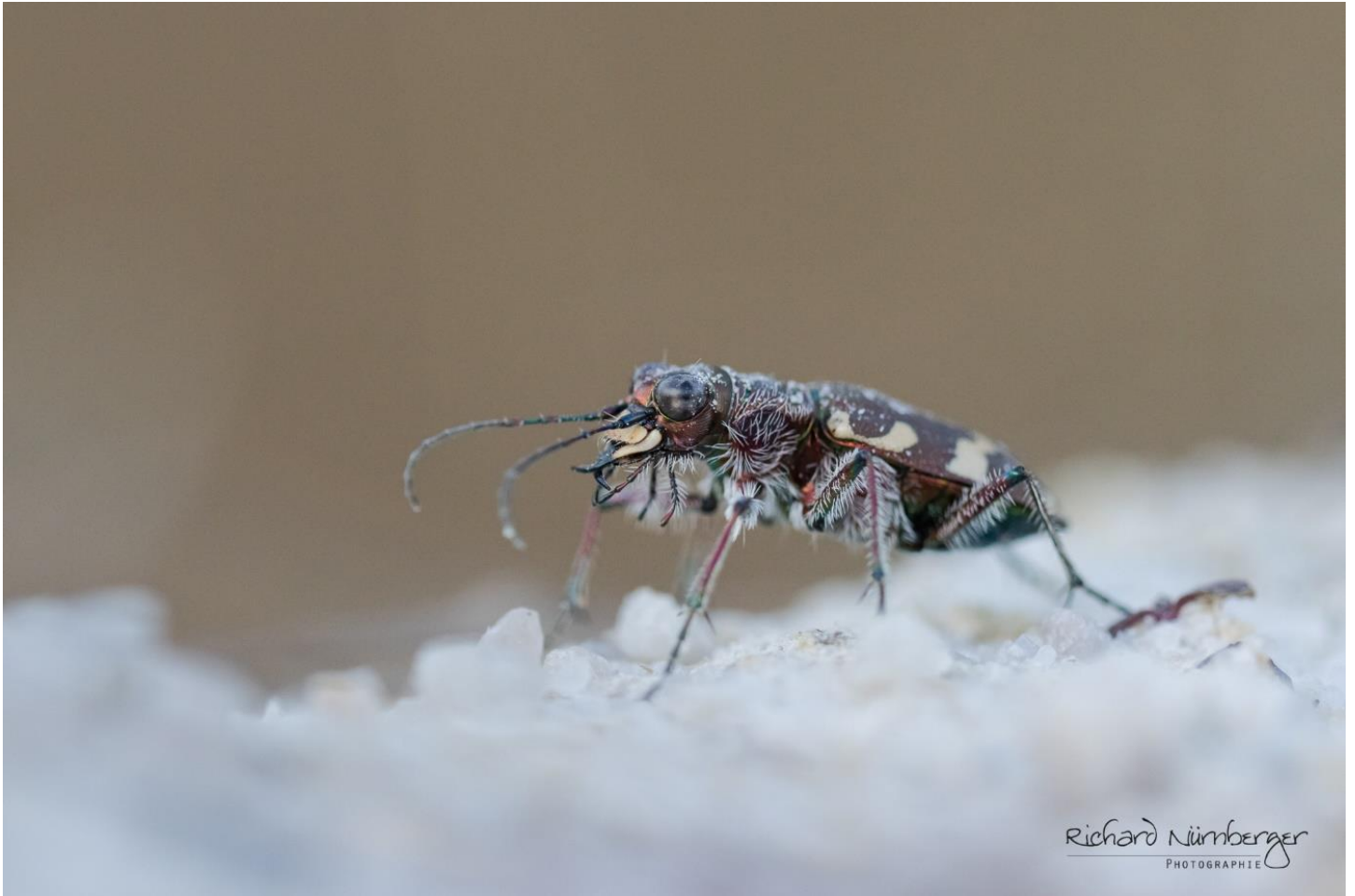
Bericht und Foto Richard Nürnberger – Ortsgruppe Neukirchen

Der etwa 1,5 cm große Laufkäfer ist auf einem unserer Grundstücke bei Edelsfeld zuhause und kann an sonnigen und warmen Tagen schon ab Ende März beobachtet werden. Das Vorkommen erstreckt sich von Europa bis nach Sibirien und Kleinasien. Sowohl Imagines als auch Larven ernähren sich von Insekten, die sie mit ihren guten Augen auf eine Entfernung bis zu 30cm wahrnehmen können. Mit den dornenbewehrten Mandibeln, die als Greif- und Kneifzange gleichermaßen dienen, packt er nicht nur zu, sondern zerkleinert auch seine Beute in mundgerechte Happen. Die Art ist in Deutschland ungefährdet.